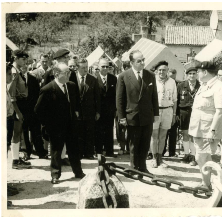
Les EF devant le monument aux morts de Saint-Clément lors du cinquantenaire.