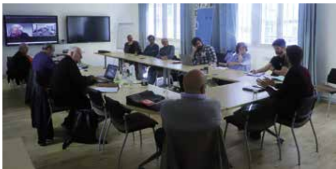
Assemblée générale de l'Adajep le 16 mai 2023, à Paris.

L'Adajep a tenu son assemblée générale le 16 mai dernier. Le conseil d'administration, le bureau, le comité de pilotage du projet « L'histoire se construit aujourd'hui », les partenaires du colloque ainsi que les archivistes du Pajep ont tous contribué à une année 2022 riche de projets.