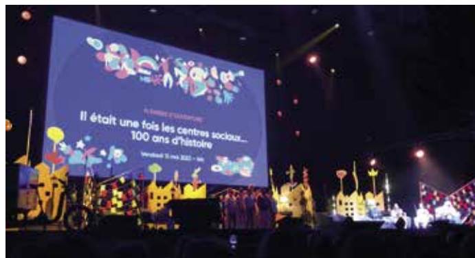
La FCSF a fêté son centenaire au mois de mai à Lille.

Du 12 au 14 mai, à Lille, la Fédération des centres sociaux de France (FCSF) a réuni en congrès 4000 acteurs de centres sociaux pour débattre autour de la démocratie en actions et de la justice sociale autant que pour célébrer son centenaire.