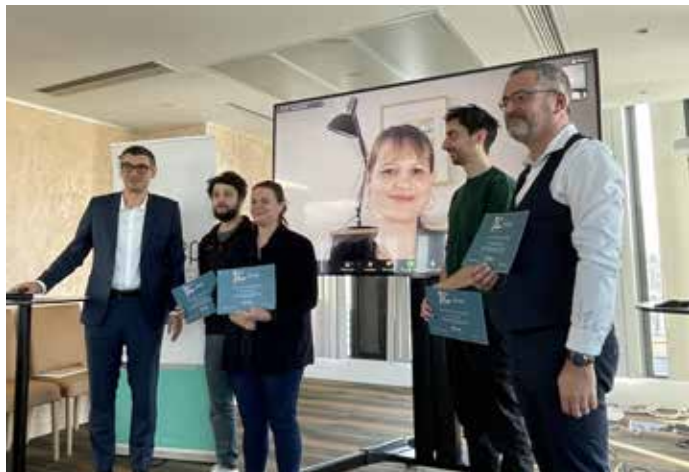
Remise du prix de l'Injep le 9 décembre 2022.