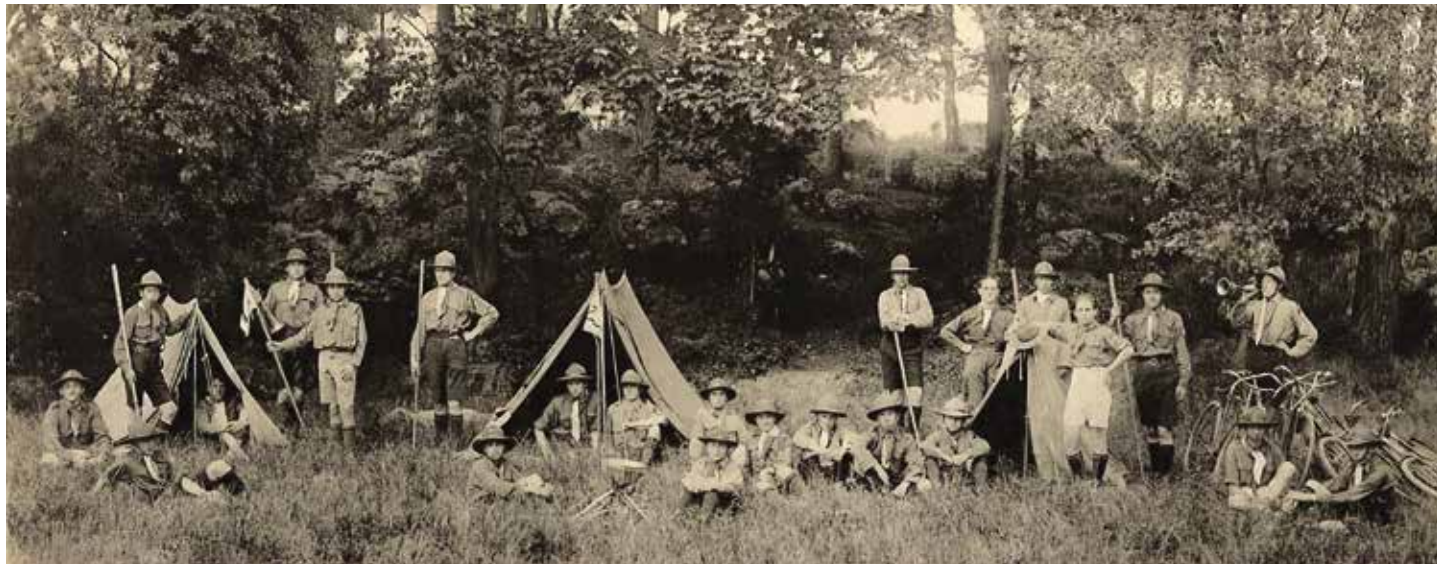
Troupe d'éclaireurs, années 1910. Archives nationales, 20141579.

À l'occasion du versement aux Archives de Lyon du fonds des Éclaireuses et Éclaireurs de France (EEDF) de la région lyonnaise, la journée du 26 avril 2023 invitait archivistes, historiens et militants à réfléchir à la valorisation des documents scouts pour encourager la recherche.