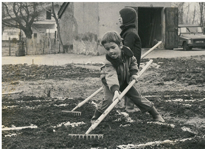
Archives dép. du Val-de-Marne, Codej 6 , non coté.

Organisé les 30 et 31 mars 2022 par le Pajep et ses partenaires, ce colloque constitue une opération majeure pour l'Adajep.