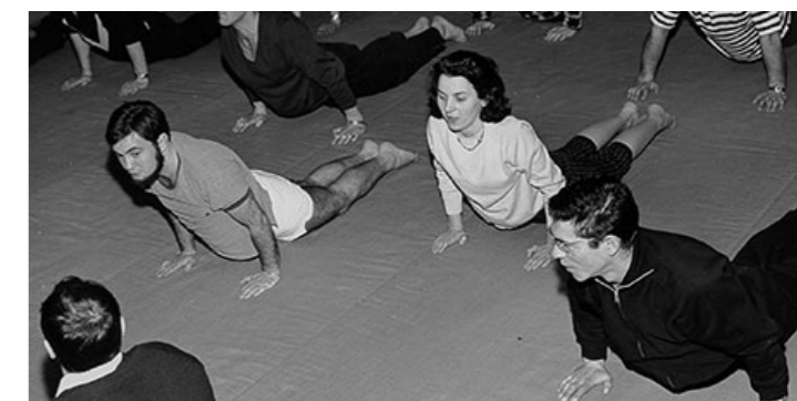
Stage d'expression corporelle, s.d.