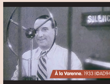
À la Varenne. 1933