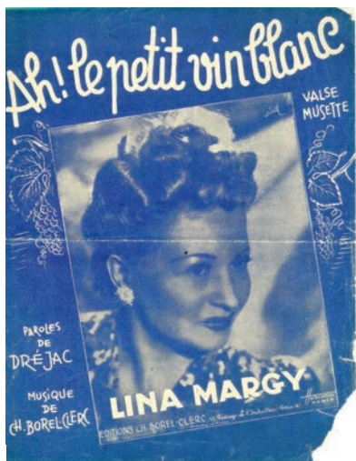
Couverture de la partition musicale Ah! le petit vin blanc. 1943

Organisée en partenariat avec l'Ihovam (Itinéraires et histoire ouvrière en Val-de-Marne)