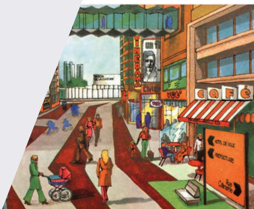
Détail d'une affiche sur le nouveau Crétail 1973 - 1975