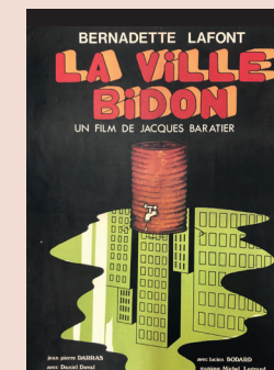
Affiche du film La ville bidon . 1976