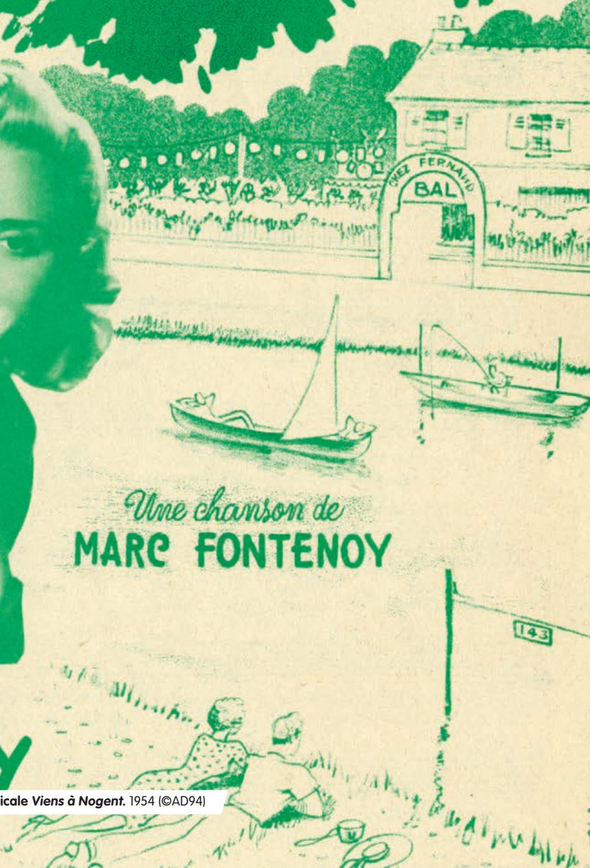
Couverture de la partition musicale Viens à Nogent. 1954

MAISON DE L'HISTOIRE ET DU PATRIMOINE SALLE D'EXPOSITION