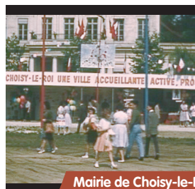
Mairie de Choisy-le-Roi. 1960