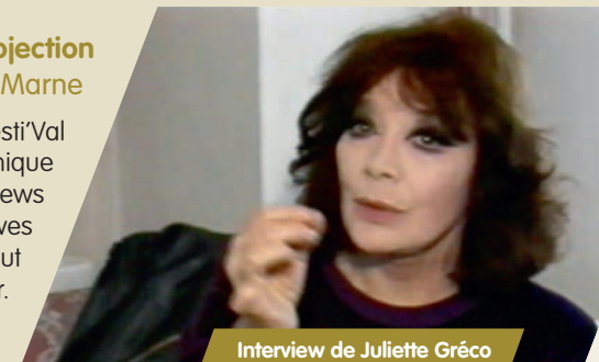
Interview de Juliette Gréco 1988