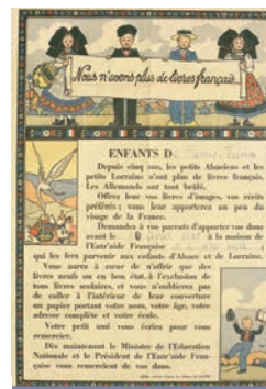
Appel au don d'ouvrage 1945

Pour la rentrée scolaire 2020, les Archives inaugurent la mise à disposition sur Internet de ressources éducatives. Avec la page de la professeure-relais et celle des archives insolites, les enseignants vont disposer à la fois de documents analysés, qui s'inscrivent dans les programmes scolaires, et d'archives originales proposant des pistes d'exploitation pédagogique.