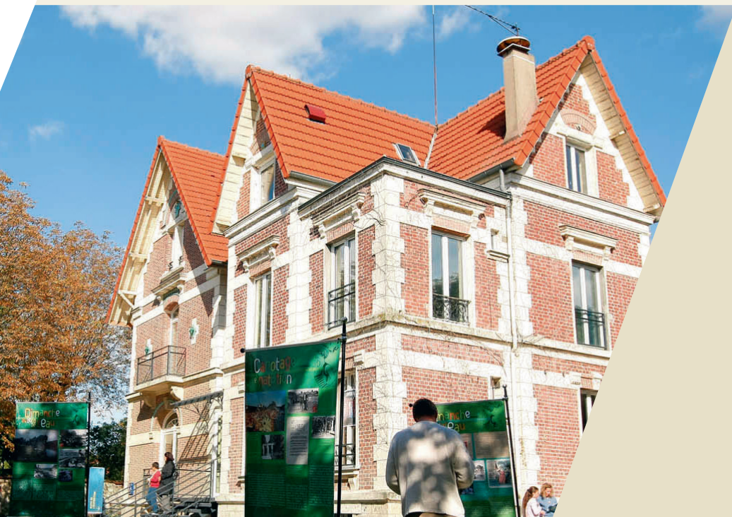
Les journées du patrimoine à la Maison de l'Histoire et du Patrimoine.

Mettant à l'honneur la chanson française, elle offre des projections d'événements musicaux qui ont marqué l'histoire culturelle du département. Elle organise des visites guidées autour de son exposition temporaire. Enfin, elle accueille un concert en plein air dans son théâtre de verdure.