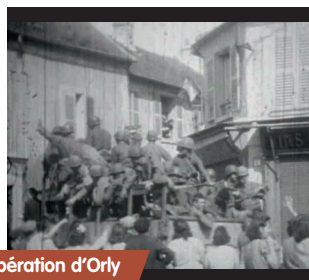
Libération d'Orly 1944