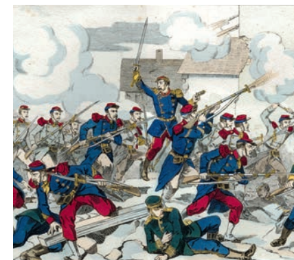
Bataille de Champigny. Fin XIX e siècle

Dans le cadre du 150 e anniversaire de la guerre franco-prussienne de 1870, chercheurs et membres des sociétés d'histoire se donnent rendez-vous pour aborder la réalité de ce conflit dans l'actuel Val-de-Marne, des combats meurtriers à l'édification de monuments commémoratifs en passant par l'occupation prussienne et le quotidien des habitants.