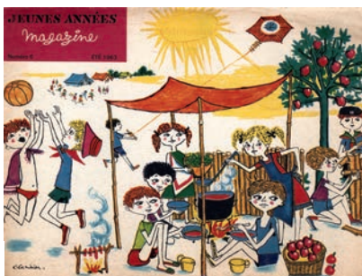
Couverture du magazine Jeunes années . Été 1963

Créé en 1999, le Pôle de conservation des archives des associations de jeunesse et d'éducation populaire constitue un partenariat reposant aujourd'hui sur quatre organismes publics et une structure privée. La table ronde, précédée d'une projection et réunissant les initiateurs et les acteurs actuels du PAJEP, offre l'occasion de revenir sur l'histoire de cette instance unique œuvrant à la sauvegarde, à la collecte et à la valorisation des archives.