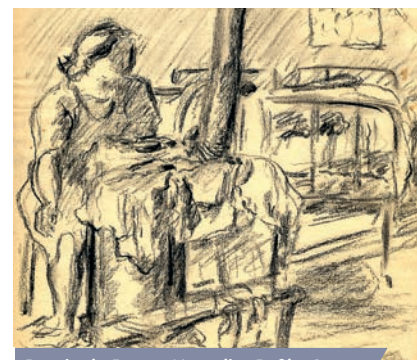
Dessin de France Hamelin, Poêle. Camp des Tourelles, 1944

Organisée par l'AFMD94 (Amis de la fondation pour la mémoire de la déportation du Val-de-Marne)