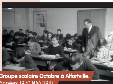
Groupe scolaire Octobre à Alfortville. Années 1970