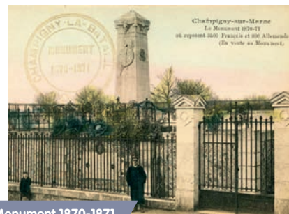
Monument 1870-1871 1910

Samedi 21 novembre • 14 h 30 - 17 h Rendez-vous : parking du Plateau à Champigny-sur-Marne