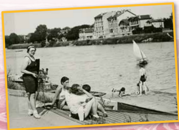
« On se baigne » (1936) (2Fi)