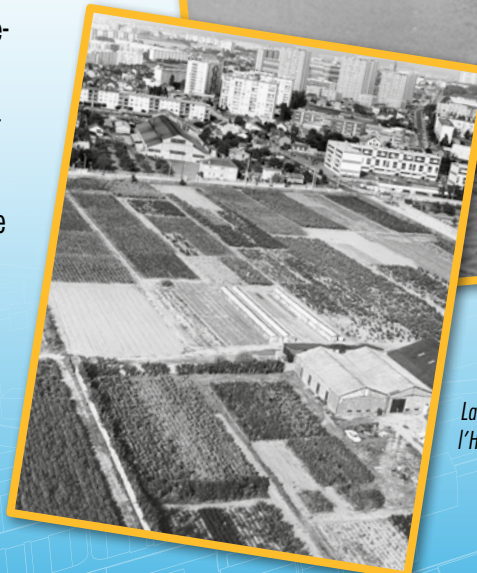
La forçerie des lilas à l'Hay-les-Roses, 1970