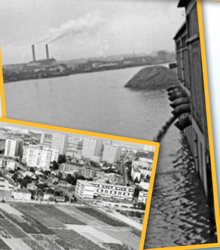
Rejets d'eaux usées dans la Seine à Alfortville, François Bibal, 1966