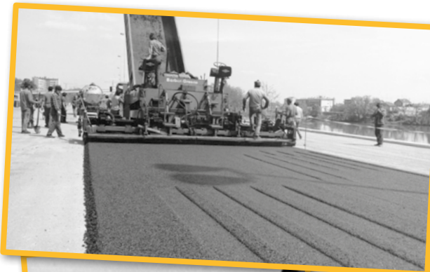
Chantier de construction de l'autoroute A4, 1975

Parce que les bouleversements environnementaux et climatiques présents et à venir puisent leurs racines dans le passé, les Archives départementales du Val-de-Marne proposent depuis 2021 les deux épisodes d'une exposition qui les décline localement, « +2° ? Les Val-de-Marnais, le climat et l'environnement 1780-2015 », afin d'en permettre l'appréhension par le public le plus large.