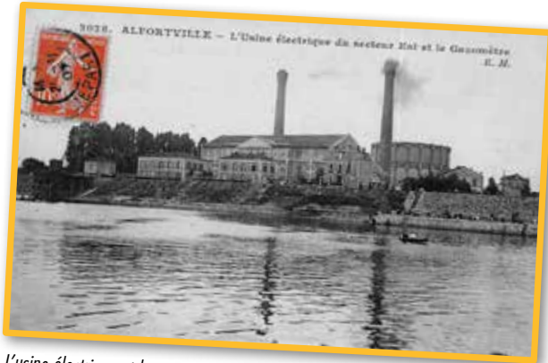
L'usine électrique et le gazomètre d'Alfortville (1907) (2Fi 02)

Depuis les transformations de Paris au XIX e Siècle et, la naissance des banlieues modernes, ces dernières reflètent les mutations de la société française telles que le développement industriel entraînant la mobilisation croissante des énergies, l'exploitation des ressources naturelles, l'artificialisation des sols, puis la désindustrialisation et les bouleversements de la « transition environnementale », marqués par l'impératif de la « durabilité » (début XXI e siècle). Ce colloque se propose de revenir sur les conséquences écologiques des transformations de la région parisienne durant deux siècles et d'aborder les moyens de prévenir ou de réparer les effets néfastes des modes de vie urbains sur l'environnement.