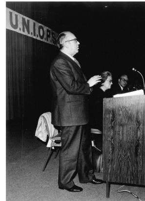
UNIOSS, 14e Congrès (Marseille, 1973)