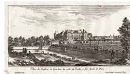
Gravure du château de Grosbois. [Vers 1750]

Construit au XVII e siècle, entièrement aménagé, meublé et décoré en style Empire par la famille du général Berhier, le château est, depuis 1962, la propriété de la Société d'encouragement à l'élevage du cheval français qui assure la conservation et la valorisation de ce patrimoine exceptionnel.