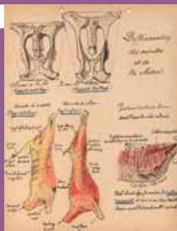
Notes manuscrites de Louis Faure sur la botanique.

Les archives du colonel vétérinaire Louis Faure (1891-1976) disposent d'un inventaire détaillé permettant de rendre compte de la carrière de cet homme, diplômé de l'École nationale vétérinaire d'Alfort en 1913, en poste en Afrique du Nord dans les années 1930 puis dans le Puy-de-Dôme jusqu'à sa retraite.