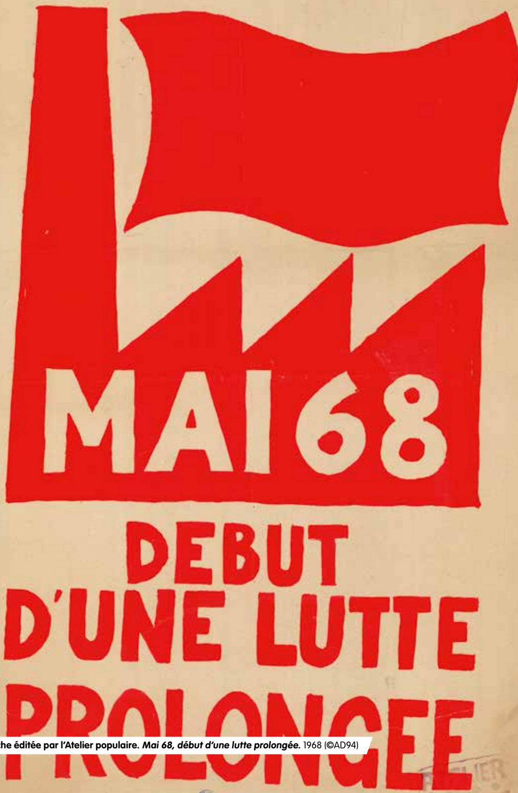
Affiche éditée par l'Atelier populaire. Mai 68, début d'une lutte prolongée . 1968 ©AD94

ARCHIVES DÉPARTEMENTALES SALLE CLAIRE BERCHE