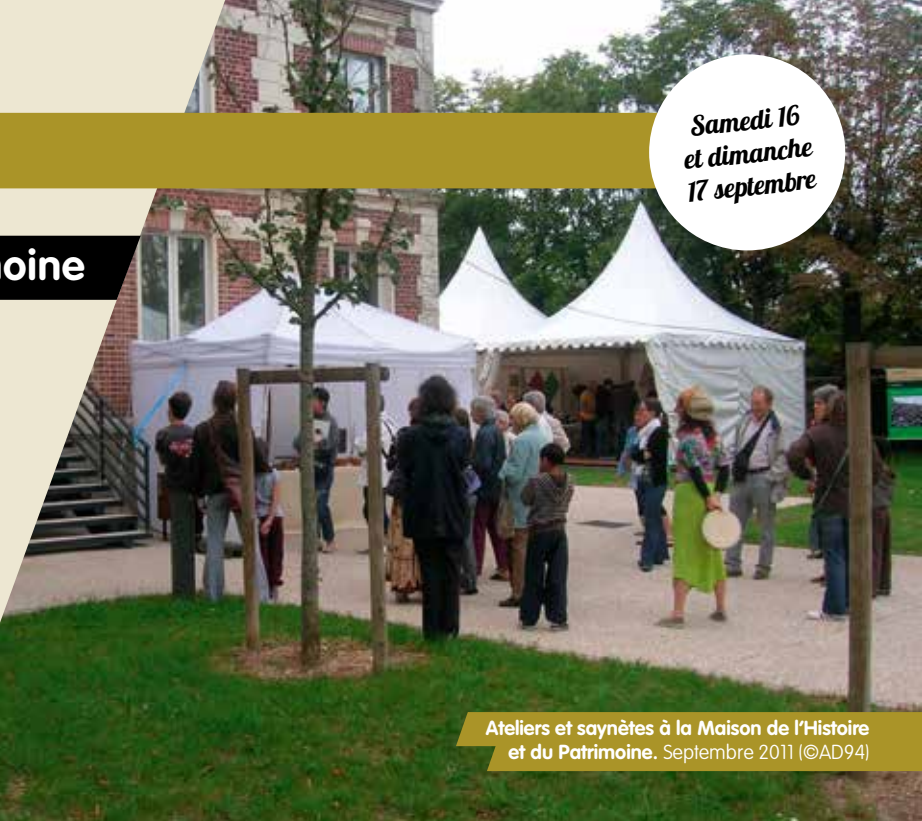
Ateliers et saynètes à la Maison de l'Histoire et du Patrimoine. Septembre 2011

En partenariat avec les Archives communales de Champigny-sur-Marne