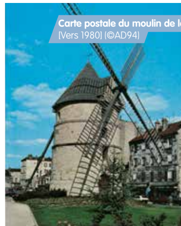
Carte postale du moulin de la Tour. [Vers 1980]